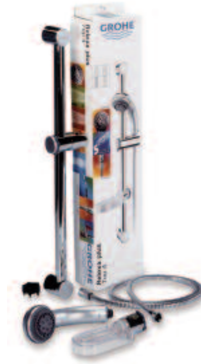
Original Brausenset „Relexa Plus Top 4“ Friedrich Grohe AG & Co. KG