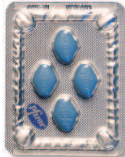
Original Viagra 100 mg Tabletten Pfizer Pharma GmbH