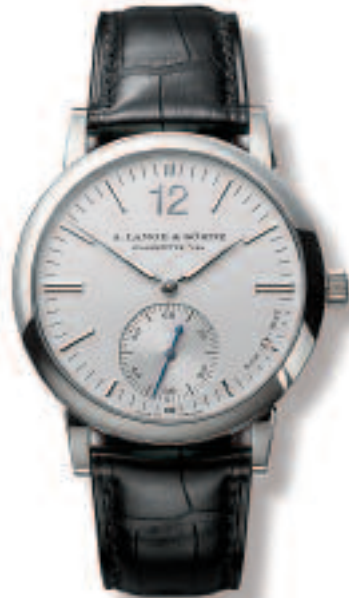
Original Armbanduhr, Modell LANGEMATIK in Platin Lange Uhren GmbH, Glashütte