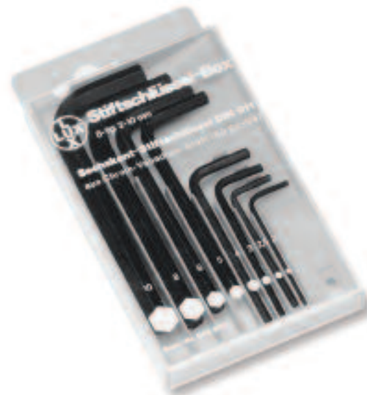
Original Inbusschlüssel-SB-Verpackung Drilbox Georg Knoblauch GmbH