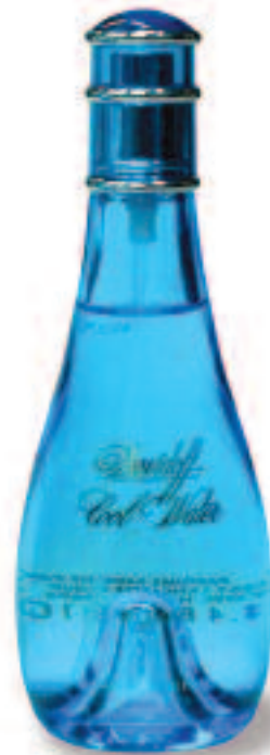
Original Davidoff Cool Water Woman, Eau de Toilette Lancaster Group GmbH