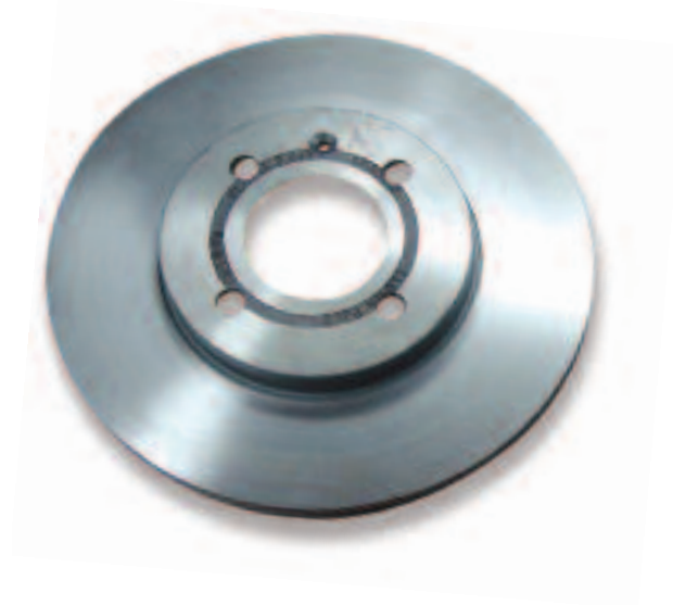
Original Bremscheibe Volkswagen AG