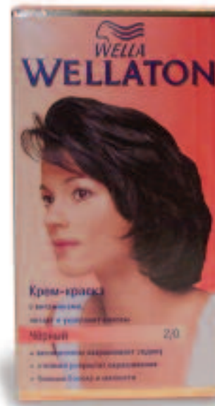
Original Wellaton Wella AG