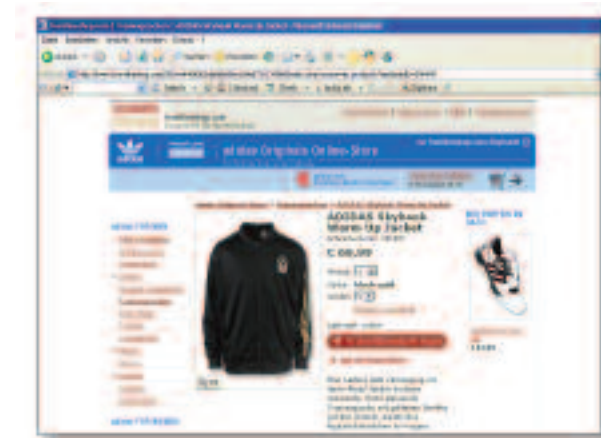
Original bei www.adidas.de

Im Internet ist das Risiko, unabsichtlich eine Fälschung zu kaufen, besonders hoch. Eine unmittelbare Prüfung der Ware auf Echtheit ist nicht möglich; so kann etwa ein Originalprodukt abgebildet sein, obwohl eine Fälschung veräußert wird. Piraten nutzen darüber hinaus gern die Anonymität/Pseudonymität des Internets, um ihre kriminellen Machenschaften zu verschleiern und den Zugriff der Ermittlungsbehörden auf Täter und gezahlte Beträge zu erschweren. Darüber hinaus fehlt dem Verbraucher bei Internet-Auktionen oft das wichtige Warnsignal eines unangemessen niedrigen Preises, weil bei Verkäufen mit Auktionscharakter ein niedriger Einstiegspreis auch bei Originalware nicht ungewöhnlich ist.