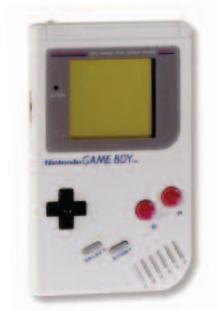
Original Gameboy Nintendo of Europe GmbH