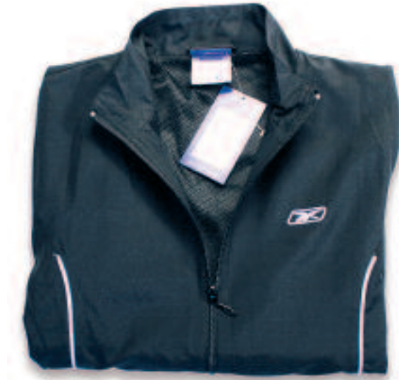
Original Trainingsjacke mit durchgehendem Reißverschluß Reebok International Limited